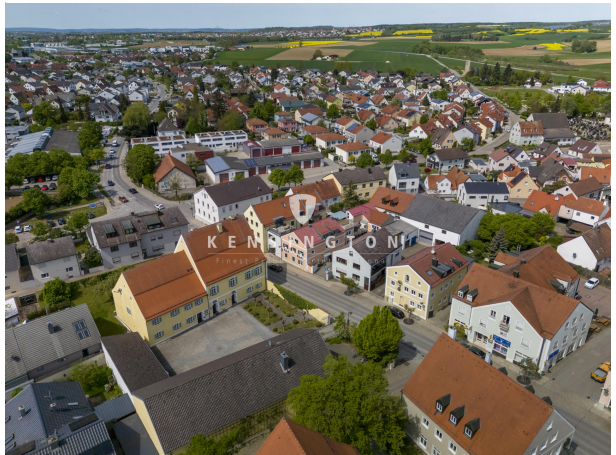
Mitten im schönen Kösching!