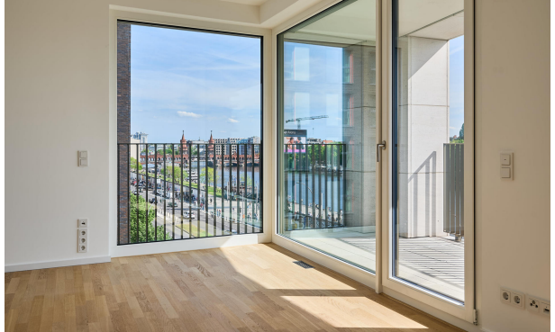
Spektakulärer Blick mit Zugang zu einer der beiden Terrassen